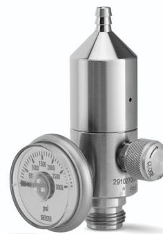
S 70 simple étage