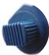
Raccord tournant inox